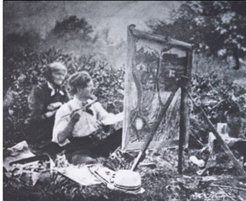
Peter August Böckstiegel mit seiner Mutter bei der Arbeit am Gemälde „Mohnblumen“ (auf der Rückseite das unvollendete „Dorf“) im Garten seines Elternhauses in Arrode, Fotografie aus dem Sommer 1912.

Viele der hier ausgestellten Bilder stammen aus privaten Sammlungen, einige unter ihnen sind seit langer Zeit oder sogar noch nie ausgestellt worden. Der Westfälische Buchenwald (die unterstrichenen Titel bezeichnen Werke in der Ausstellung) galt in den letzten 30 Jahren als gestohlen, bevor er im Jahr 2020 wieder seinem Eigentümer, der Westfälischen Rentenversicherung in Münster, übergeben werden konnte. Diese wiederum hat das Bild inzwischen dem Museum als Dauerleihgabe überlassen, um es der Öffentlichkeit zu präsentieren. Das Selbstbildnis mit Mutter versteckte sich, über Jahrzehnte für die Forschung unbemerkt, auf der Rückseite des Bauernmädchens aus dem Osthaus Museum in Hagen. Böckstiegels Werk mag gut erforscht sein – es bietet jedoch immer wieder Platz für neue Entdeckungen. Wir wünschen Ihnen dabei und in der Ausstellung viel Vergnügen!