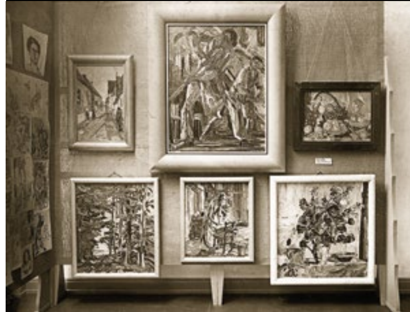
Peter August Böckstiegels Gemälde und Zeichnungen (links) in der Ausstellung der Bielefelder Handwerker- und Kunsthandwerkerschule, Fotografie einer Ausstellung aus dem Herbst / Winter 1913.